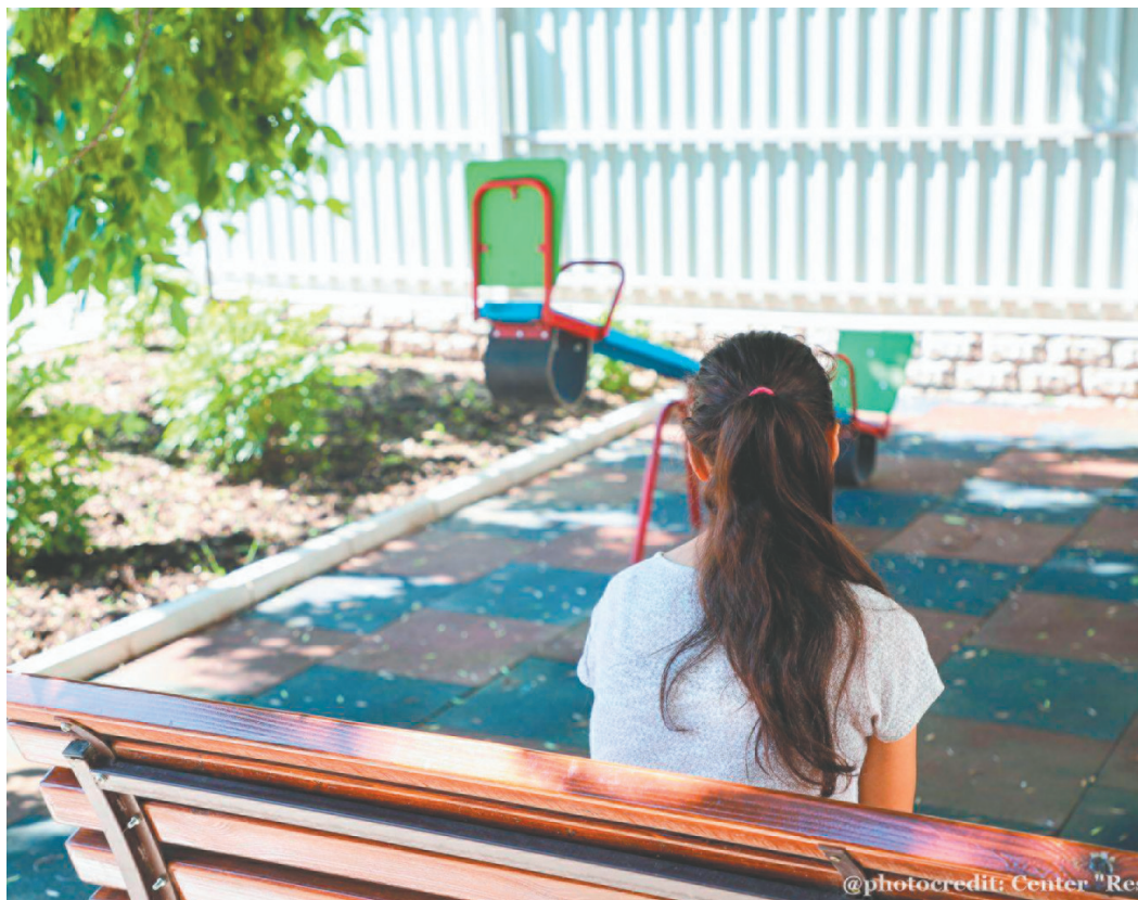
Fotografie simbol.

O altă situație este pe malul drept, unde victima violenței în familie poate solicita emiterea unei ordonanțe de protecție . Aceasta este un document